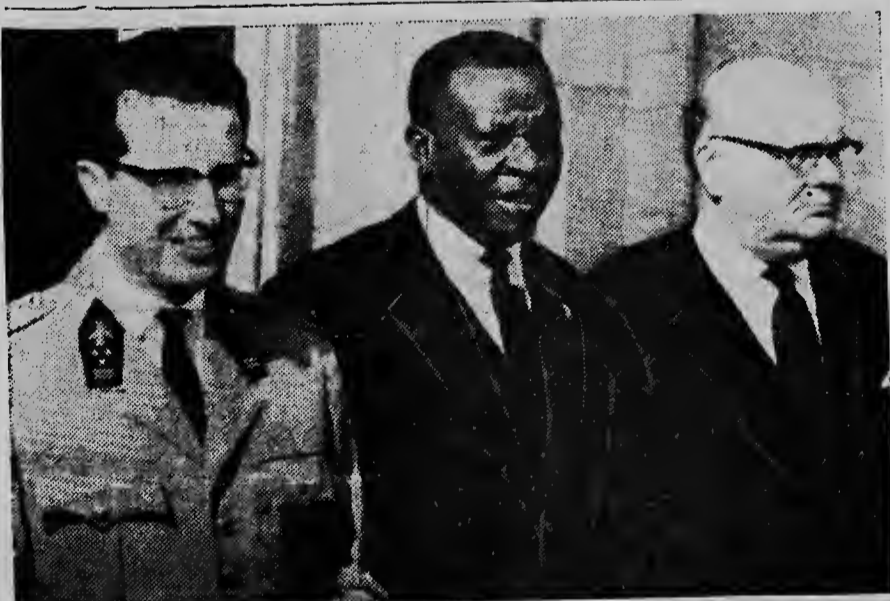
Rey Boudewijn di Belgica a ricibi e premier Kongoles Cyrille Adoela den capital Belgicano. Riba e foto na banda drechi nos ta mira e ministro Belgicano pa asuntonan exterior Paul Henri Spaak.

BONN. 4 maart. — E agencia di prensa ADN na Alemania Occidental a participa awe cu un miembro di embahada Ruso na Bonn a hanja orden un di e ultimo dianan aqui pa bandona Alemania Occidental.